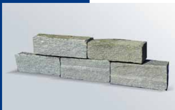
Blocchi da muratura in Beola "Silver Grey"