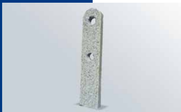
Caracciolo in serizzo "Antigorio/Formazza"