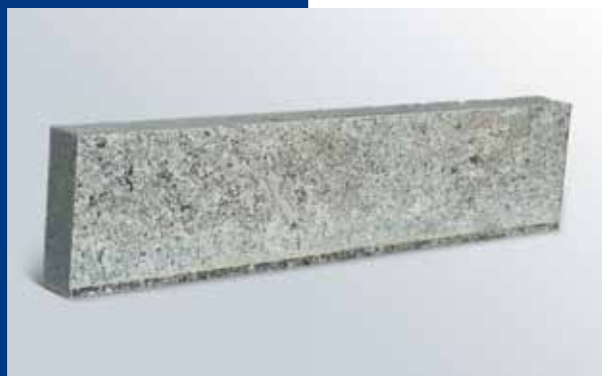
Cordolo tipo Milano in "Bianco Montorfano"