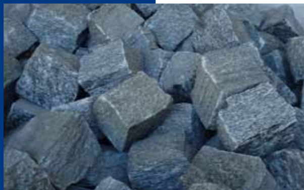
Cubetti in Beola "Silver Grey" per pavimentazione