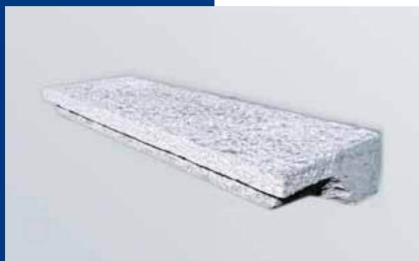
Davanzale in Beola "Silver Grey"